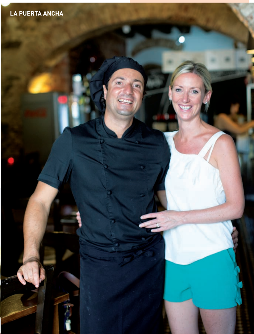
LA PUERTA ANCHA

Plaza de la Laguna, 14 Ayamonte (Espanha) Tel.: (+34) 959320666 Todos os dias, das 12h00 às 16h00 e das 19h00 às 23h45 Preço médio: 20 euros facebook.com/lapuertaanchayamonte