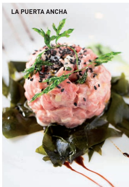
LA PUERTA ANCHA